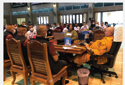
ตำรวจภูธรภาคสี่จังหวัดขอนแก่นเข้ารับการฝึกอบรมเพื่อฟื้นฟูสมรรถภาพทางด้านร่างกายและจิตใจที่มีความพร้อมในการปฏิบัติหน้าที่อย่างมีประสิทธิภาพ ณ อโรคยศาล วัดคำประมง จังหวัดสกลนคร เมื่อ ๑๗ ธันวาคม ๒๕๖๕