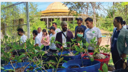
คณะบุคลากรทางการแพทย์และนักธุรกิจชาวมาเลเซีย สังกัดสมาคมมาเลเซีย Malaysia Hemptech Industrial Research Association (MHIRA) ศึกษาดูงานการใช้ประโยชน์กัญชา กันชงและสมุนไพรทางการแพทย์ ณ อโรคยศาล วัดคำประมง จังหวัดสกลนคร เมื่อ ๓ ธันวาคม ๒๕๖๕