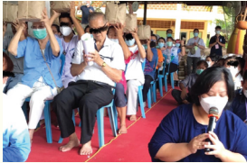
การรับผู้ป่วยใหม่

หลวงตายังคงมุ่งเน้นการพัฒนาอาคาร สถานที่ควบคู่กับการรักษาผู้ป่วยมะเร็งทั้งภายในอโรคยศาลและการรักษาตัวที่บ้านโดยอาศัย Telemedicine กับการบริการส่งยาถึงบ้านผู้ป่วยอย่างต่อเนื่องโดยไม่คิดค่าใช้จ่ายใดๆ ทั้งสิ้น พร้อมกับการให้บริการด้านการให้ความรู้แก่องค์กรและประชาชนต่างๆ ในการอบรม ศึกษาดูงาน ด้านการดูแลรักษาผู้ป่วยมะเร็งแบบประคับประคองตามแนวอโรคยศาล วัดคำประมง และน้อมนำการพึ่งพาตัวเองตามหลักปรัชญา “เศรษฐกิจพอเพียง” ของรัชกาลที่ ๙ มาใช้กับอโรคยศาล วัดคำประมงได้แก่การ ปลูกข้าว ปลูกผัก ปลูกสมุนไพร เพื่อเลี้ยงเจ้าหน้าที่และผู้ป่วยมาตลอด