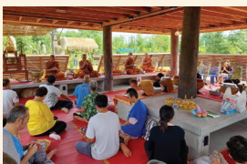
คณะกรรมการฯ เจ้าหน้าที่ และประชาชนร่วมทำบุญ