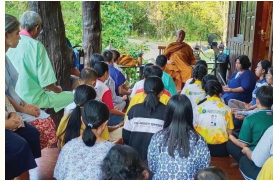
หลวงตาให้ความรู้นักศึกษา