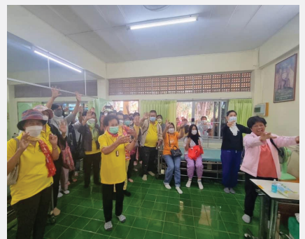
กลุ่มอาสา I SEE U+ จัดอาสาบูรณารักษ์จำนวน ๕๐ คน เป็นจิตอาสาเพื่อผู้เปราะบางเรื่อง ณ อโรคยศาล วัดคำประมง จังหวัดสกลนคร ระหว่าง ๑๓-๑๕ ธันวาคม ๒๕๖๕