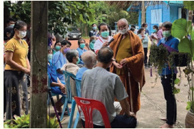
หลวงตาตรวจและรักษาโรคแก่ผู้ป่วยมะเร็ง