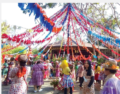
ชมรมมวยโบราณและรำวงย้อนยุคสกลนครร่วมกันจัดทำกิจกรรมเพื่อผู้เปราะบางเรื่องวัดคำประมง ณ อโรคยศาล วัดคำประมง จังหวัดสกลนคร เมื่อ ๑๔ ธันวาคม ๒๕๖๕