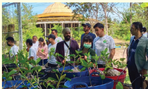
ผู้สนใจเยี่ยมชมอาคารห้วยอูรุ เฟส ๒