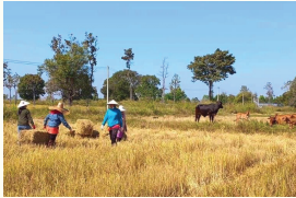
การปลูกข้าว