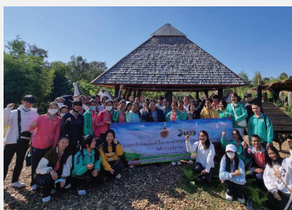
อาจารย์และนักศึกษาจากมหาวิทยาลัยเทคโนโลยีราชมงคลอีสานและสหรัถนเวชคลินิกออกค่ายอาสาแพทย์แผนไทย หลวงตาและอาจารย์ไธษณบรยายการดูแลรักษาผู้เปราะบางเรื่องระยะสุดท้าย ระหว่าง ๑๖-๑๘ ธันวาคม ๒๕๖๕