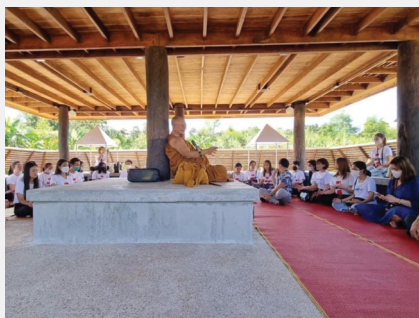
นักศึกษาแพทย์แผนไทยมหาวิทยาลัยราชภัฏบ้านสมเด็จเจ้าพระยาศึกษาดูงาน ณ อโรคยศาล วัดคำประมง จังหวัดสกลนคร ระหว่าง ๓-๕ ตุลาคม ๒๕๖๕