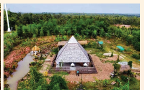
ศาลาพิระมิตกับการจัดภูมิสถาปัตยกรรมแบบธรรมชาติ