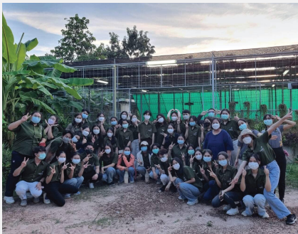
คณะแพทยศาสตร์มหาวิทยาลัยมหาสารคาม หลักสูตรการแพทย์แผนไทยประยุกต์บัณฑิต นิสิตชั้นปีที่ ๓ เข้าศึกษาดูงาน ณ อโรคยศาล วัดคำประมง เมื่อ ๑๒ กันยายน ๒๕๖๕