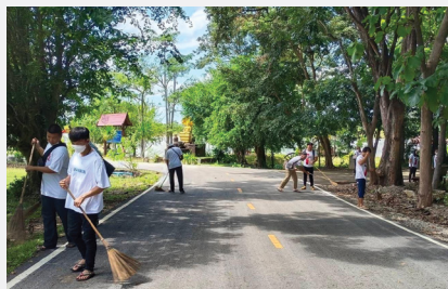
ผู้บริหารและพนักงานบริษัท Toyota Best สว่างแดนดิน จังหวัดสกลนคร จัดกิจกรรม CSR บำเพ็ญประโยชน์และทำกิจกรรมเพื่อผู้เปราะบางร่วมกับ การปฏิบัติสมาธิ ภาวนา ณ ศูนย์ศาลาพิระมิต อโรคยศาล วัดคำประมง จังหวัดสกลนคร เมื่อ ๕ ตุลาคม ๒๕๖๕