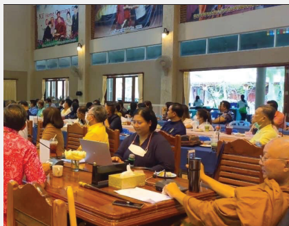
คณะบุคลากรทางการแพทย์สำนักงานสาธารณสุขจังหวัดสระบุรี ศึกษาดูงานอโรคยศาล ณ อโรคยศาล วัดคำประมง จังหวัดสกลนคร เมื่อ ๒๓ พฤศจิกายน ๒๕๖๕