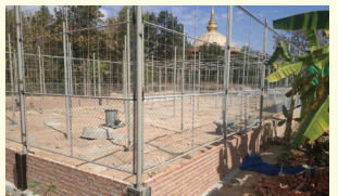
การดำเนินการก่อสร้างอาคารห้วยอูรุ