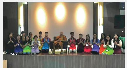
คณะแพทยศาสตร์มหาวิทยาลัยธรรมศาสตร์นิมนต์หลวงตาเป็นอาจารย์พิเศษสอนนักศึกษาชั้นปีที่ ๑ หลักสูตรวิทยาศาสตร์บัณฑิต สาขาวิชาการแพทย์แผนไทยประยุกต์และหลักสูตรปรัชญาดุษฎีบัณฑิต หัวข้อเรื่อง การดูแลระดับประคองผู้ป่วยด้วยการแพทย์แผนไทย เมื่อ ๒๗ ตุลาคม ๒๕๖๕