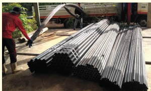
การเตรียมวัสดุเพื่อก่อสร้างอาคารห้วยอูรุ