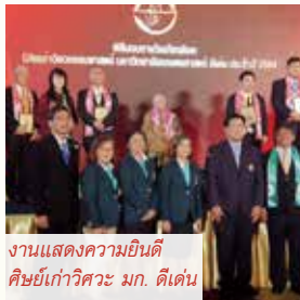
งานแสดงความยินดีศิษย์เก่าวิศวะ มก. ดีเด่น

ในช่วงเดือนกันยายน-ธันวาคม ๒๕๖๔ อโรคยาศาลวัดคำประมงได้ประกาศงดรับผู้ป่วยมะเร็งรายใหม่ เข้ารับการรักษาเนื่องจากสถานการณ์โรคระบาดโควิด-๑๙ ยังมีการแพร่ระบาดอย่างกว้างขวางยังไม่มีข้อยุติ หลวงตาได้หารือกับคณะกรรมการมูลนิธิอโรคยาศาลและผู้เกี่ยวข้อง เพื่อวางแผนการบริการผู้ป่วยให้ดีที่สุดเมื่อถึงเวลาเปิดบริการใหม่และการบริการผู้ป่วยเก่าให้มีคุณภาพที่ดีโดยการดูแลรักษาและติดตามอาการอย่างใกล้ชิดพร้อมส่งยาไปให้อย่างต่อเนื่อง