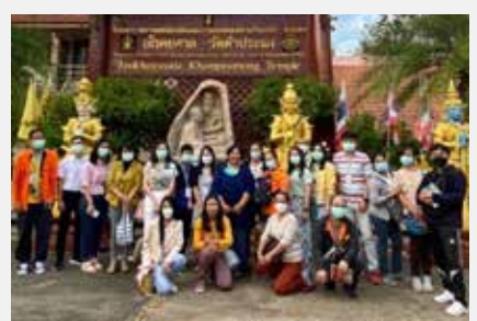
กลุ่มงานการแพทย์แผนไทย รพ. มะเร็งอุดรธานี เป็นจิตอาสาดูแลผู้ป่วยและศึกษาดูงาน ณ อโรคยศาล วัดคำประมง จังหวัดสกลนคร ระหว่าง ๑๑-๑๒ ธันวาคม ๒๕๖๔