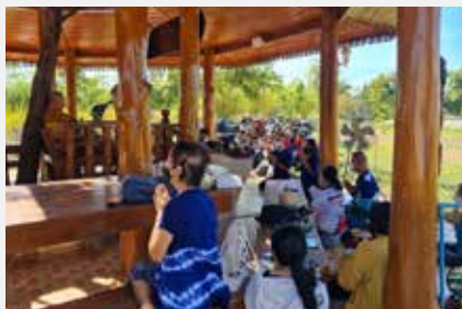
หลวงตาพร้อมด้วยจิตอาสาและประชาชน ร่วมลง แยกเกี่ยวข้าว นาพระอินทร์ ณ อโรคยศาล วัดคำ ประมง เมื่อ ๖ พฤศจิกายน ๒๕๖๔