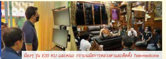
น้องๆ รุ่น E35 KU และคณะ กราบนมัสการหลวงตาและติดตั้ง Telemedicine