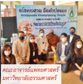
คณะอาจารย์แพทยศาสตร์ มหาวิทยาลัยธรรมศาสตร์