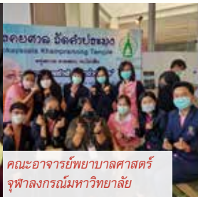
คณะอาจารย์พยาบาลศาสตร์ จุฬาลงกรณ์มหาวิทยาลัย