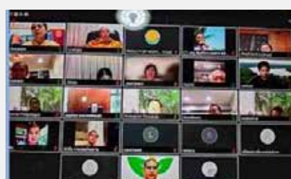
หลวงตาพร้อมประชุมทางไกลกับคณะกรรมการมูลนิธิ อภิญญาณอโรคยาศาล พร้อมด้วยเครือข่ายแพทย์ แพณไทยและจิตอาสาเรื่อง “การบริหารจัดการอโรคย ศาล วัดคำประมงโดยคงอัตลักษณ์เดิมอย่างยั่งยืน” ที่ประชุมมีมติเลือกคณะแพทยศาสตร์ มหาวิทยาลัย ธรรมศาสตร์เป็น Host เมื่อ ๑๑ ตุลาคม ๒๕๖๔