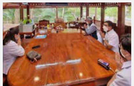
ผู้ตรวจราชการเขต ๔ กระทรวงสาธารณสุข นพ. ปราโมทย์ เสถียรรัตน์ ได้กราบบนมติการหลวง ตา และตรวจเยี่ยม ณ อโรคยศาล วัดคำประมง เมื่อ ๑๖ พฤศจิกายน ๒๕๖๔