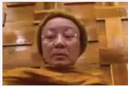
หลวงตาสอนผ่านสื่อทางไกล “การดูแลผู้ป่วยระยะ สุดท้าย Palliative care in Thai traditional medicine” แก่นักศึกษา คณะแพทยศาสตร์ มหาวิทยาลัยธรรมศาสตร์ เมื่อ ๒๔ ตุลาคม ๒๕๖๔