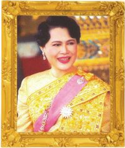
ทึมายุกา โทตุ มหาราชนึ “ขอพระองค์ทรงพระเจริญ”

มูลนิธิอภิญญา ม.อ.ศ. อโรคยศาล The Aphinye Arakheesale Foundation www.aharapinong.org