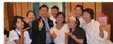
จิตอาสาวัดคำประมง